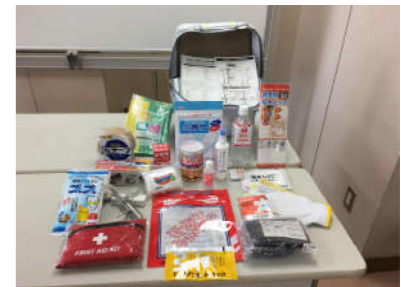
《地震対策30点避難セット》