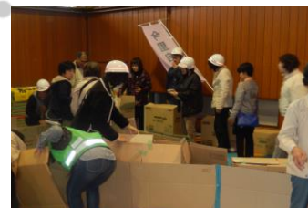
長三小校区避難所運営訓練の様子